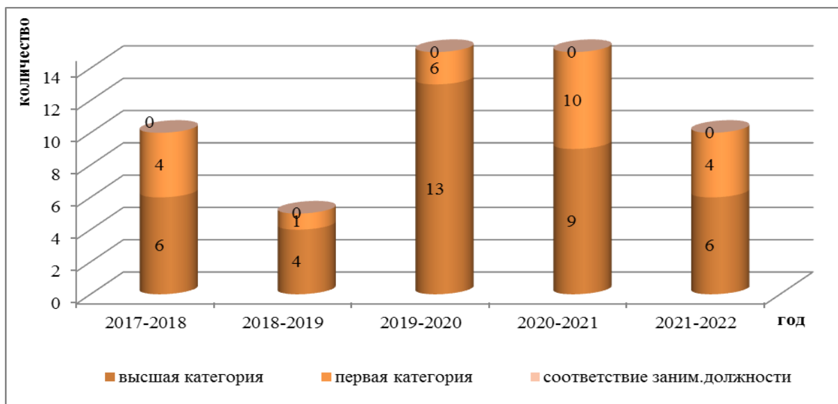
Рис. 4.4.2. Сравнительные количественные показатели аттестации педагогических работников за пять лет

Курсы повышения квалификации педагогических работников способствуют повышению профессионального мастерства педагогов, методически компетентных и психологически грамотных в постоянно обновляющихся условиях модернизации образования.